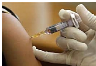
L'Institut Pasteur du Cambodge dispose d'un centre de vaccinations internationales

L'Institut Pasteur du Cambodge forme les chercheurs et biologistes Cambodgiens de demain.